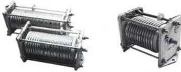
CW-202 / CW-203